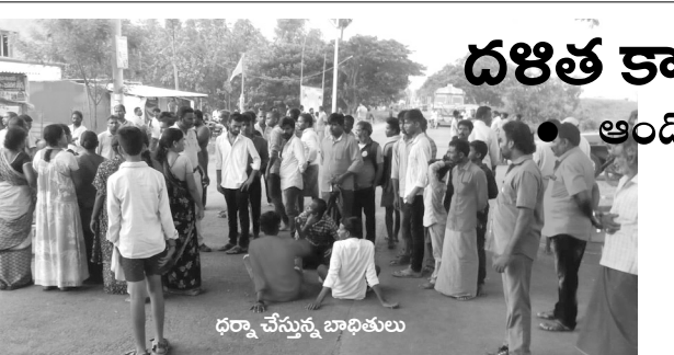
ధర్నా చేస్తున్న బాలికలు

అగ్నిపథ్ అగ్రహ జ్వాలలు, విద్యుంసాలకు ప్రధాని మోడీనే బాధ్యత వహించాలని సిపిఐ జాతీయ కార్యదర్శి నారాయణ అన్నారు. శు క్రవారం తిరుపతిలో ఆయన మీడియాతో మాట్లాడారు. ఎన్నికల్లో లబ్ధి పొందేందుకే అగ్నిపథ్ తీసుకొచ్చారని విమర్శించారు. యువతను హెచ్చం చేస్తున్నారని మండిపడ్డారు. నాలుగు సంవత్సరాల తర్వాత ఉద్యోగం నుంచి తీసివేస్తే వారి భవిష్యత్తు ఏమిటని ప్రశ్నించారు. బీహార్‌లో ప్రారంభమైన ఈ ఉద్యమం స్వదేశాభివృద్ధి చేరిందన్నారు.ఎన్నికల ముందు రెండు కోట్ల ఊర్వీగాలు ఇస్తామని హామీ ఏమైందని కేంద్రాన్ని ప్రశ్నించారు. సీఆర్‌ జాతీయ పార్టీ పెట్టుకుంటే తప్పై లేదని, అయితే బిజెపికి వ్యతిరేకంగా పోరాడుతున్న కూటమిలో కలిసి పనిచేస్తే మంచిదని హితవు పలికారు.